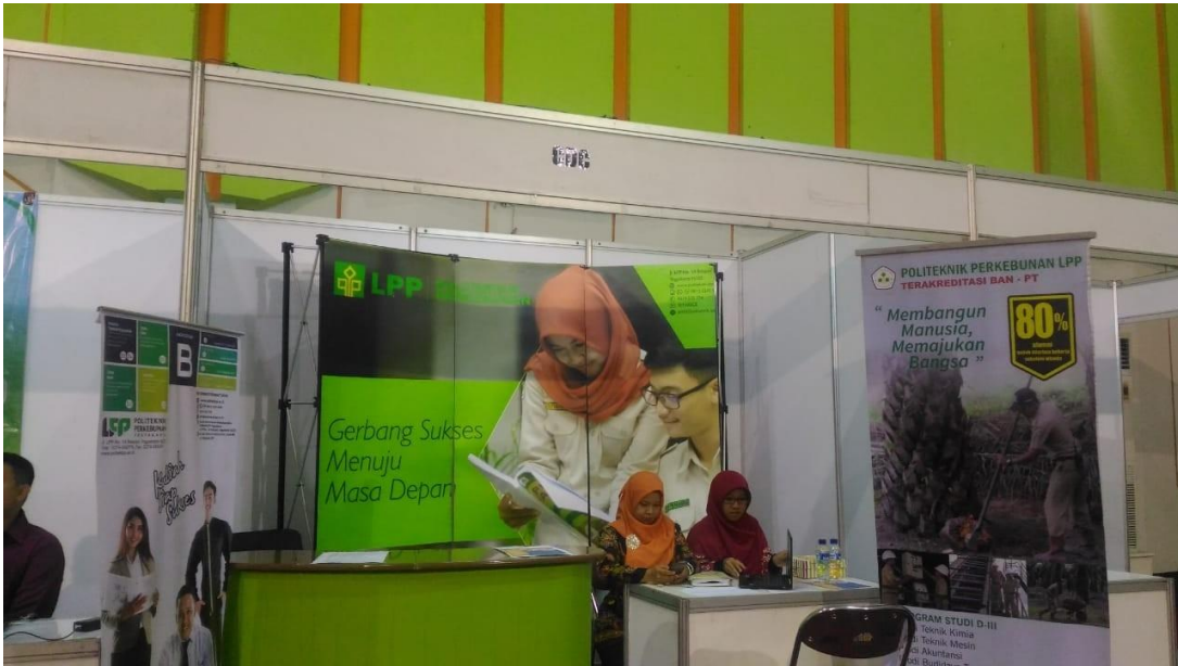
Salah satu booth pada Kegiatan 2 nd Annual Plantation Career Expo 2018