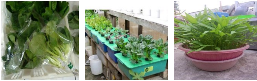
Gambar 1. Hasil Usaha Java Indo Farm Berupa Sayuran Hidroponik