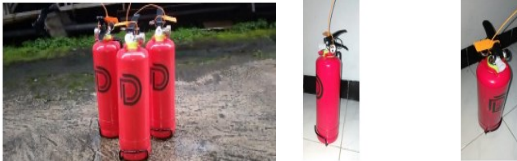
Gambar 3. Hasil Produk C-DISVO ( Capar Diapers Skin Avocado )

Kendala dalam produksi C-DISVO yaitu melakukan uji coba yang berulang kali dengan selalu melakukan evaluasi agar dapat digunakan selayaknya pemadam api dan percobaan yang dilakukan memiliki tingkat kegagalan yang tinggi. Sehingga perlu perubahan formula, bahan maupun strategi pembuatan yang membuat penemuan produk yang sesuai memerlukan rentang waktu yang cukup panjang.